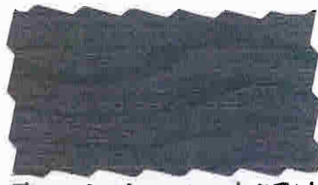
FERNVITRIOL 9061 JOTUN