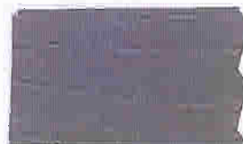
GRÅ SKIFER 1462 JOTUN