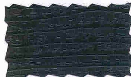
MØRK BRUN 16 TYRI