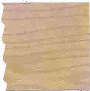
SETERGUL 545 BUTINOX