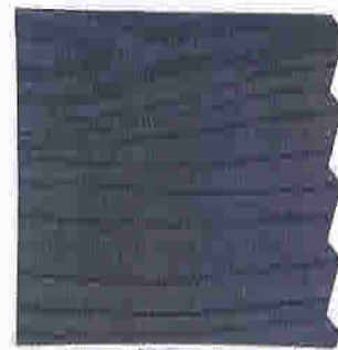
BLÅGRÅ 589 BUTINOX