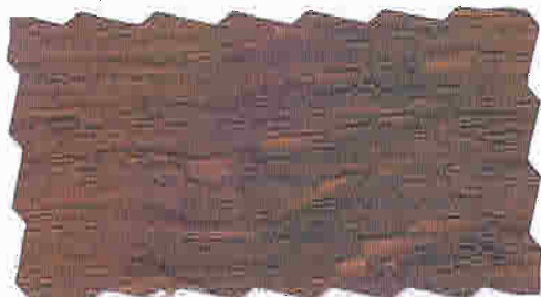
BYGDEBRUN 820 TREBITT