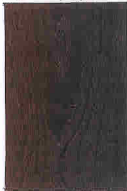
SLIDRE FR 6025