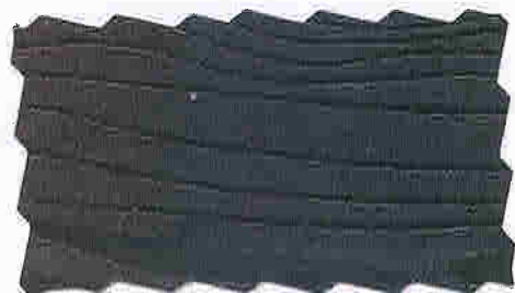
TJÆREBRUN 57 TYRI